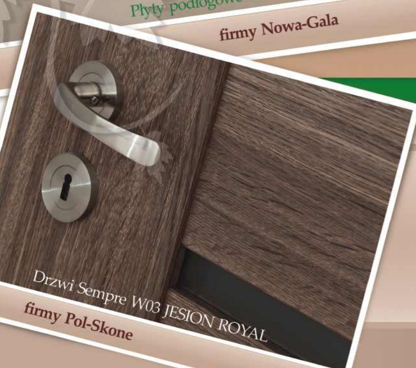
Drzwi Sempre W03 JESION ROYAL firmy Pol-Skone