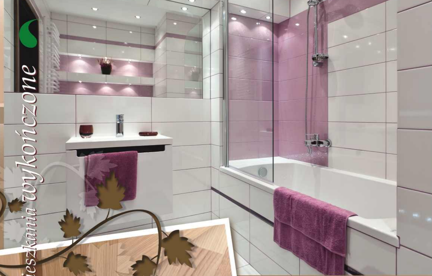
Kolekcja płytek SYNTHIA firmy Cersanit