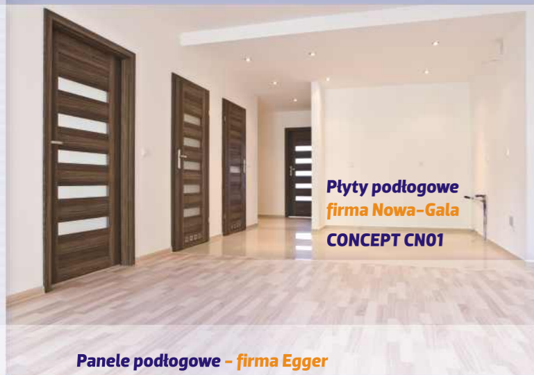
Płyty podłogowe firma Nowa-Gala CONCEPT CN01