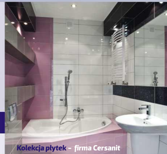
Kolekcja płytek – firma Cersanit SYNTHIA FIOLETOWA