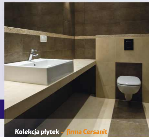
Kolekcja płytek – firma Cersanit AZULEV ORION