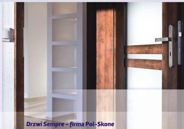
Drzwi Sempre – firma Pol-Skone ORZECH ANTYCZNY