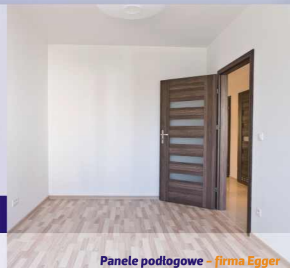
Panele podłogowe – firma Egger JESION BIAŁY