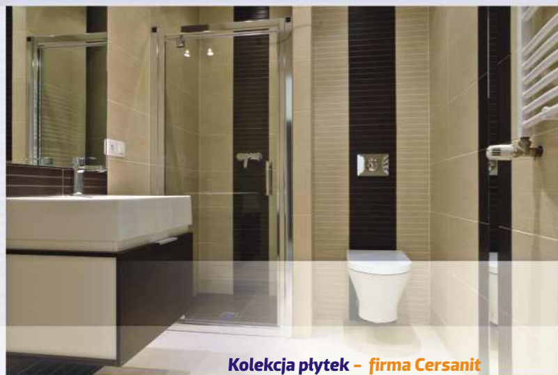
Kolekcja płytek – firma Cersanit MINIMON DURANGO