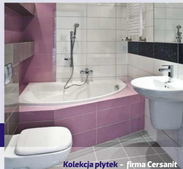
Kolekcja płytek – firma Cersanit SYNTHIA FIOLETOWA